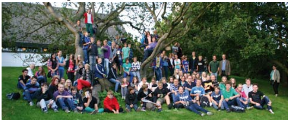
Zum Abschluss ist der Kletterbaum neben der Kirche für das Gruppenfoto eine originelle Abwechslung