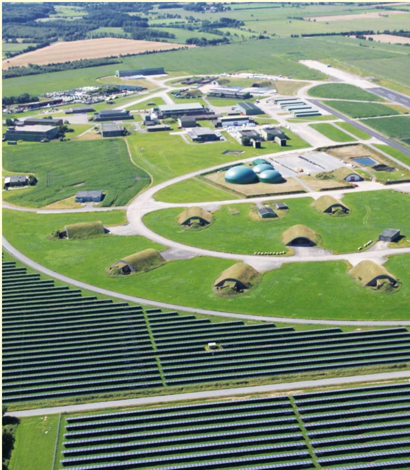
Der ehemalige Flugplatz Eggebek entwickelt sich zum Energie- und Technologiepark