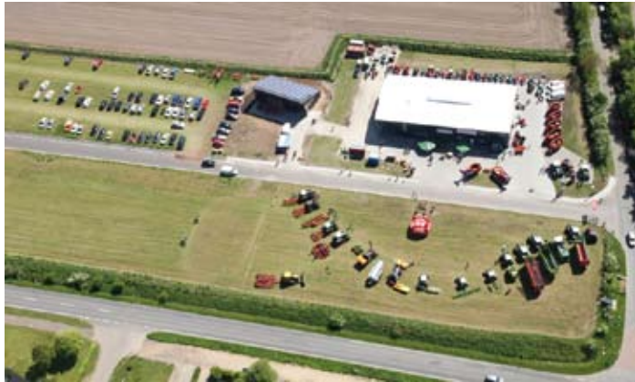
Landtechnik Wanderup lud zur Eröffnung des Neubaus ins neue Gewerbegebiet Westerfeld ein

Wer von Husum kommend nach längerer Fahrt durch das einsame Nordfriesland endlich den verdichteten Ort Wanderup erreichte, sah gleich am Ortszugang zur linken Seite „Landtechnik Wanderup“. Dies ist jahrzehntelang so gewesen. Landwirtschaftliche Nutzfahrzeuge, Kommunaltechnik,