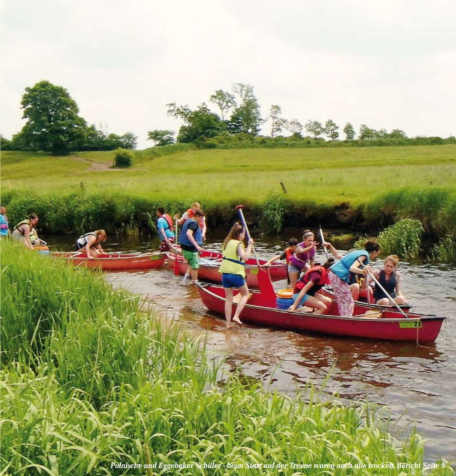
Polnische und Eggebeker Schüler - beim Start auf der Treene waren noch alle trocken. Bericht Seite 9