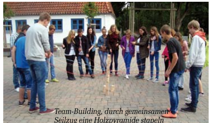
Team-Building, durch gemeinsamen Seilzug eine Holzpyramide stapeln