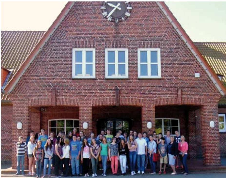
Die beiden Schülergruppen aus Eggebek und Biala Piska vor dem Eingangportal der Eichenbachschule

Im nächsten Jahr wird die Alexander-Behm-Schule in Tarp die Schülerbegegnung fortsetzen.