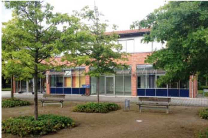
In den nächsten Wochen entsteht hier ein Contact Center

Zum 01.10.2014 nimmt die care4as GmbH in Eggebek ihre Tätigkeiten auf. In den ehemaligen Räumlichkeiten der Änderungsschneiderei und des Spielzeugladens in der Hauptstraße 4 werden künftig Beratungs- und Kundenservice-Dienstleistungen für namhafte Unternehmen durchgeführt.