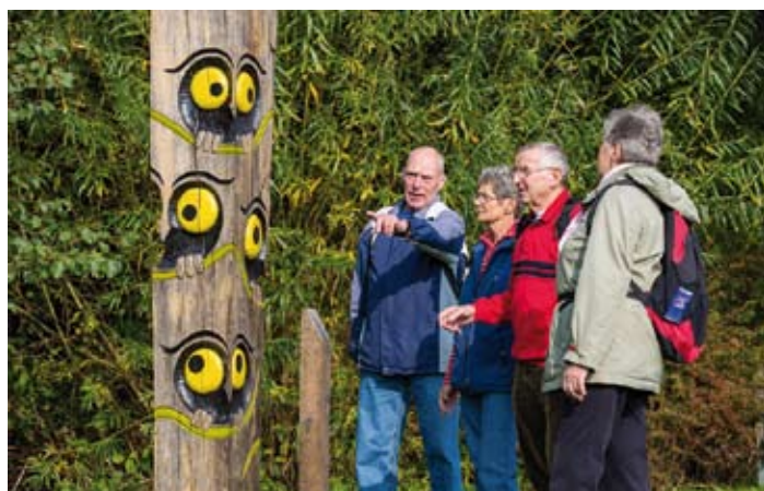
Die individuellen Eulenskulpturen laden zum Verweilen und Interpretieren ein.

der zehn Kilometer langen geführten Route in und um die beschauliche Gemeinde herum. Günter Itzke von der Volkswandergruppe Tarp e.V. nimmt Interessierte mit auf eine Reise zu markanten Punkten aus der Tarper Geschichte. Begleitet wird er von dänischen Übersetzern, so dass auch Besucher aus dem Norden von Itzkes Wissen profitieren können. Die geführte Wanderung beginnt jeweils um 9:30 und 12:30 Uhr an der Alexander-Behm-Schule.