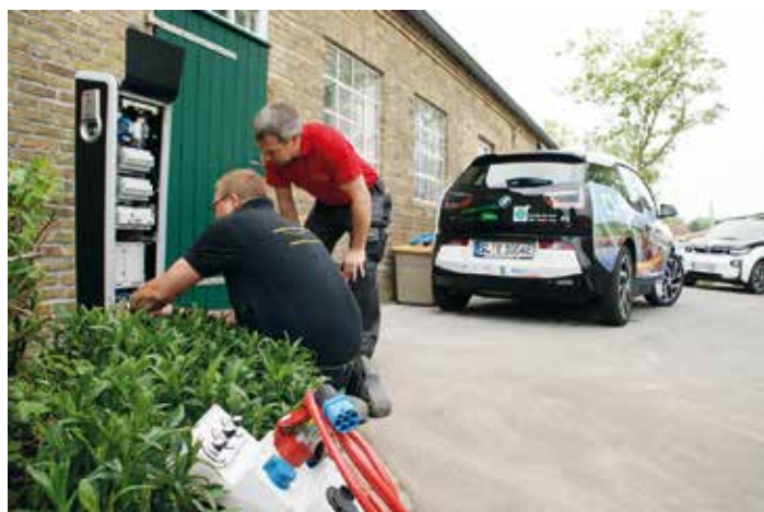
Die Elektriker aus Fockbek machen den letzten Funktionstest an der Ladesäule. Insgesamt sollen bis Ende Juni elf stehen.

In der Flusslandschaft Eider-Treene-Sorge zwischen Flensburg, Husum, Schleswig, Rendsburg und Heide wird derzeit ein Netz aus Ladesäulen für Elektroautos errichtet. Eine der ersten steht in Bargen an der Eider, dem Sitz der Regionalentwicklungsagentur Eider-Treene-Sorge GmbH.