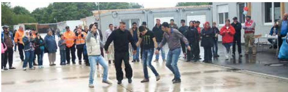
Spontane folkloristische Tänze zu arabischen Klängen für die Besucher des Willkommenscafés

Zur Stärkung der Gäste hatten einige Bewohner das afghanische Gericht Pakora aus Kichererbsenmehl mit frittierten Kartoffeln und verschiedenen Gemüsearten zubereitet, das regen Zuspruch fand, auch wenn einige Besucher je nach kulinarischer Experimentierfreude erst