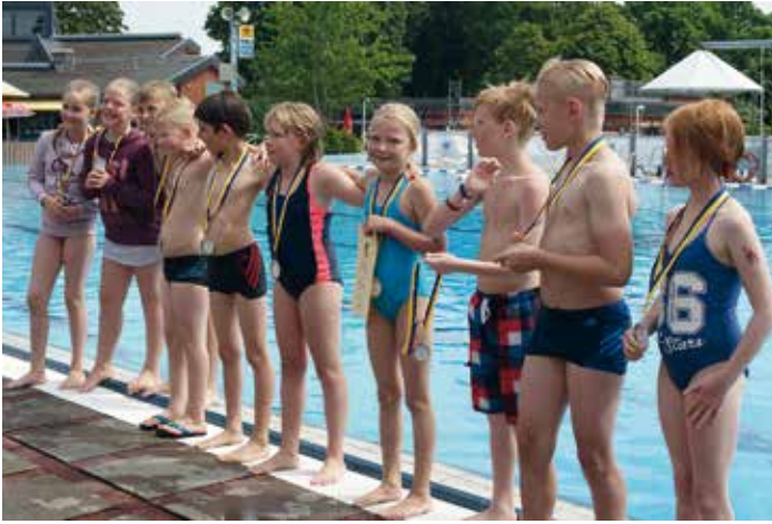
Die erfolgreiche Mannschaft der Grundschule Eggebek. Herzlichen Glückwunsch zu diesem tollen Erfolg.