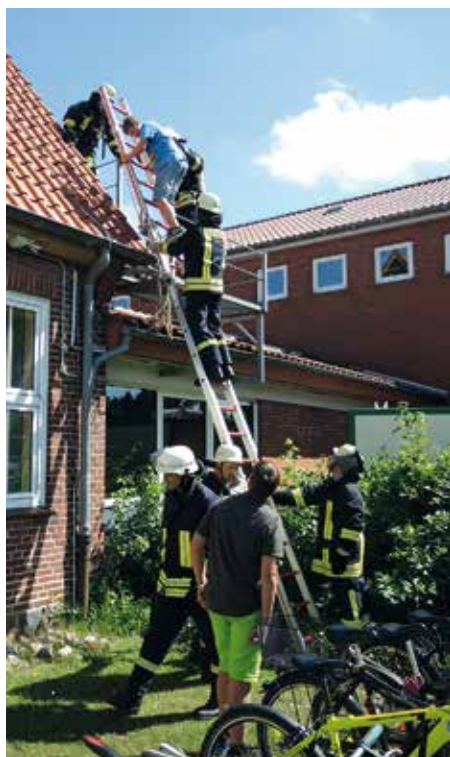
Der Atemschutztrupp Eggebek rettet bei der Alarmübung die beiden Schüler aus der verqualmten Schulküche und bringt sie mit Hilfe der Kameraden der Feuerwehr Langstedt über die Feuerwehrleiter ins Freie.