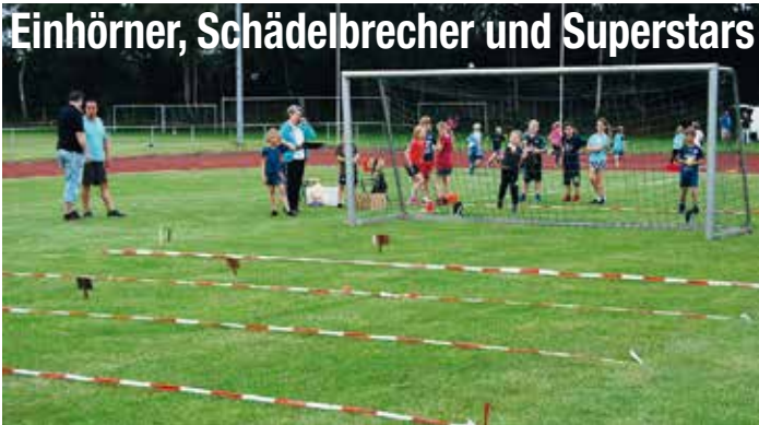
Einhörner, Schädelbrecher und Superstars Bundesjugendspiele mal anders: Nachdem das Tor überwunden ist, landet der Ball in einer der fünf Wurfzonen.

„Dieses Jahr machen wir es mal ganz anders...“, klang die Stimme durch das Mikrofon. Am Freitag, den 9.7.2017 überraschten die Lehrerinnen der Grundschule Kleinjörll ihre Schülerinnen und Schüler mit einer ganz neuen Form der offiziellen Bundesjugendspiele Leichtathletik auf dem Eggebeker Sportplatz. Bisher kannten die Schülerinnen und Schüler den traditionellen Wettkampf mit den drei Disziplinen Weitsprung, Sprint und Weitwurf und die Alternative in Form des Wettbewerbs Leichtathletik, bei dem in Zonen gesprungen und geworfen, der