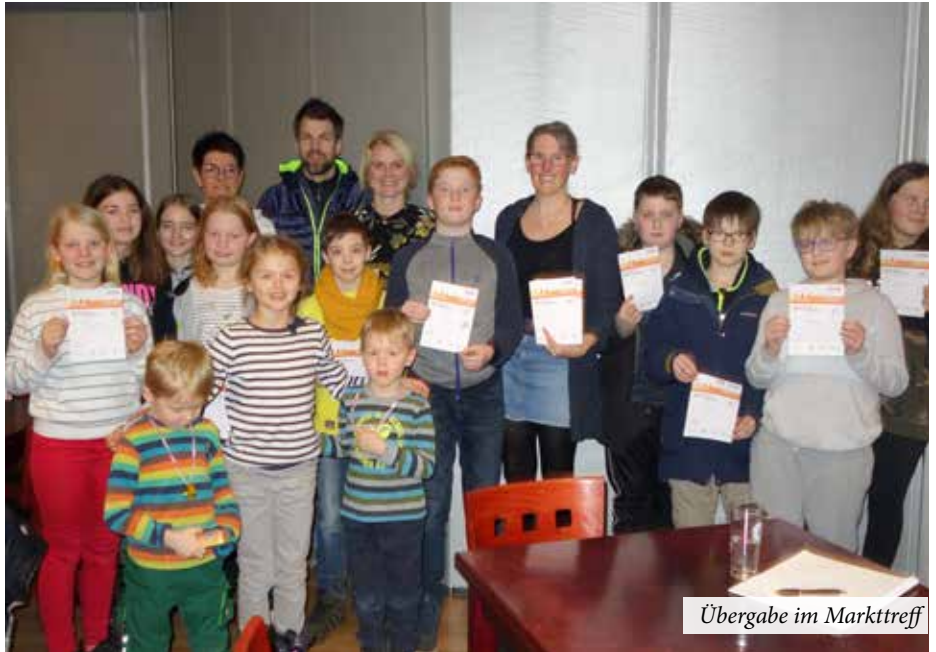
Übergabe im MarktTreff