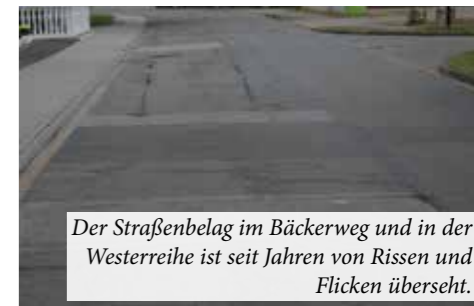
Der Straßenbelag im Bäckerweg und in der Westerreihe ist seit Jahren von Rissen und Flickern überseht.