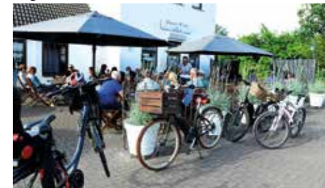
Kurz einmal Halt an der Hauptstraße in Eggebek machen. Der Flammkuchen ist schnell serviert.