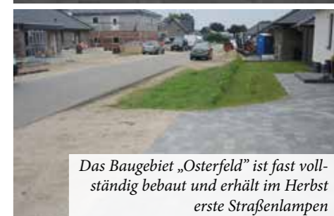
Das Baugebiet „Osterfeld“ ist fast vollständig bebaut und erhält im Herbst erste Straßenlampen

Bürgermeister die Arbeit des gemeindlichen Jugendteams.