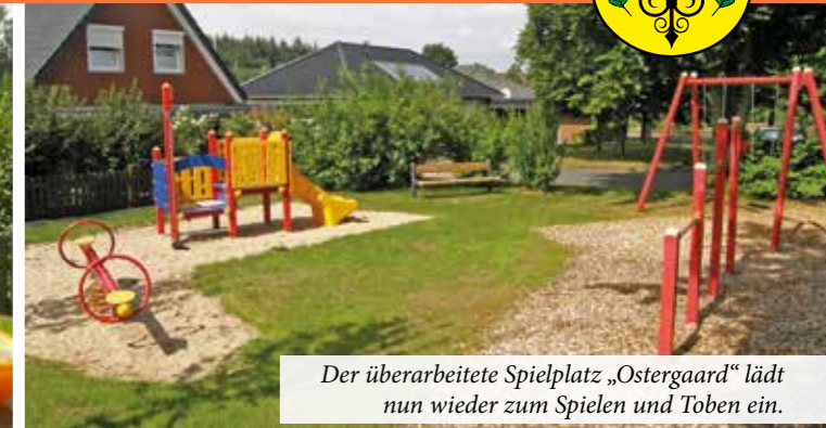
Der überarbeitete Spielplatz „Ostergaard“ lädt nun wieder zum Spielen und Toben ein.